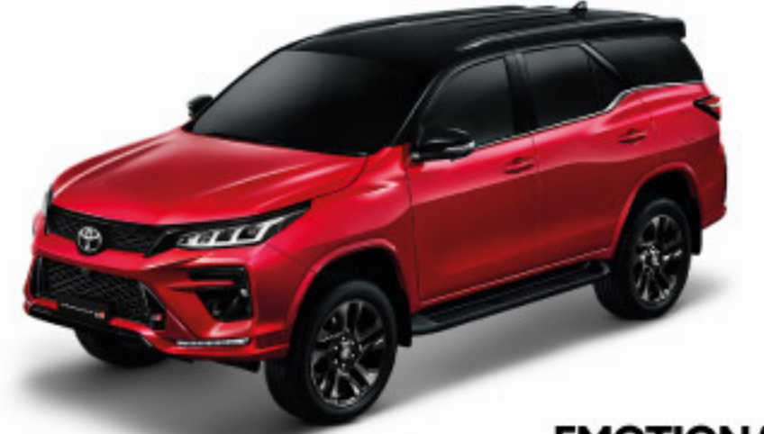
EMOTIONAL RED BLACK TOP