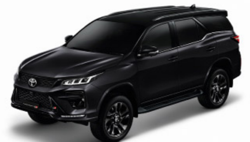
ATTITUDE BLACK MICA