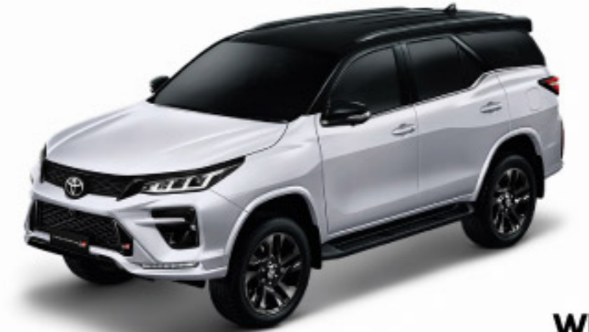
WHITE PEARL CS BLACK TOP