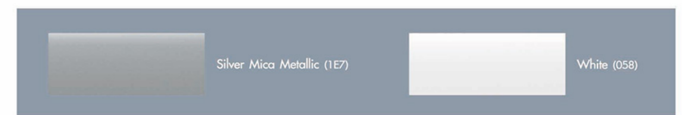
หมายเหตุ: รุ่นไฮเอช Eco ตู้ทีป มีเฉพาะสี White (058)