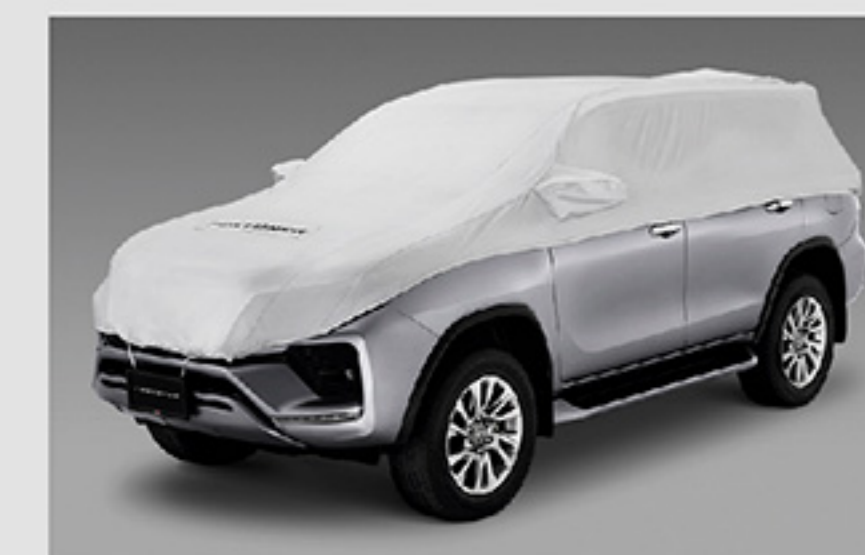
ผ้าคลุมรถแบบครึ่งคัน