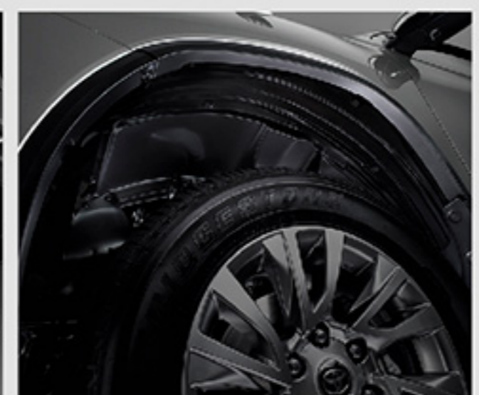
ชุดกันโคลนขุมล้อ