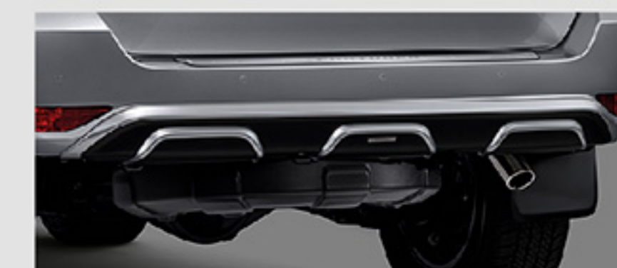
ชุดตกแต่งกันชนหลัง