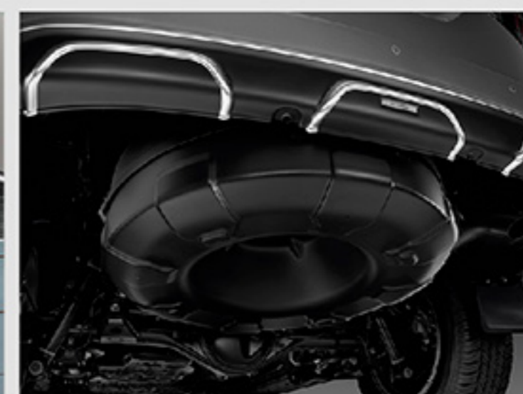
ชุดฝาครอบยางอะไหล่