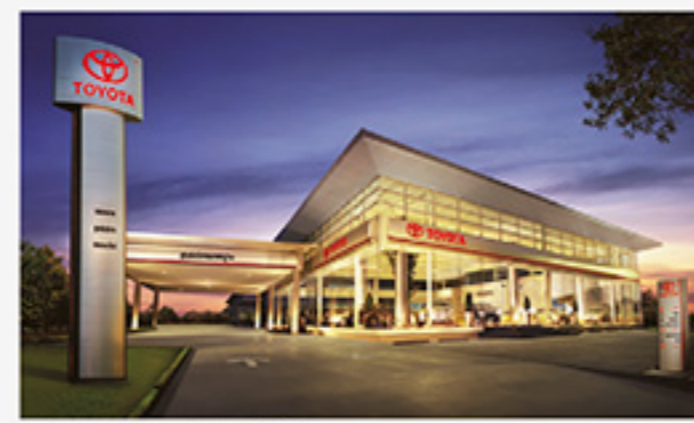
*ข้อมูล ณ เดือนมกราคม 2565

ด้วยใจดีเกี่ยวกับที่ซื้อบริการให้เป็นมาตรฐานหนึ่งเดียว โดยใช้คำขายใจจริงและศูนย์บริการมาตรฐานถึง 465 แห่งทั่วประเทศ* สู่ทุกที่ทั่วไทย ก่อเกิดบริการให้คุณอุ่นใจได้ตลอดการเดินทาง