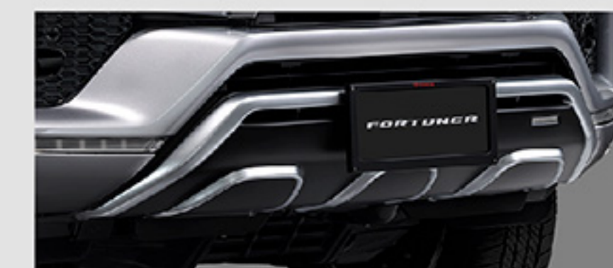
ชุดตกแต่งกันชนหน้า