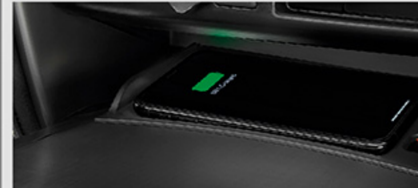
อุปกรณ์ชาร์จไฟแบบไร้สาย