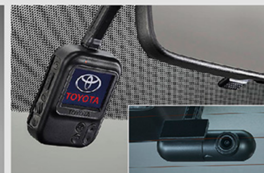
กล้องบันทึกภาพด้านหน้าและหลัง