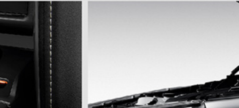
อุปกรณ์ช่วยผ่อนแรงเปิด-ปิด ฝากระโปรงหน้า