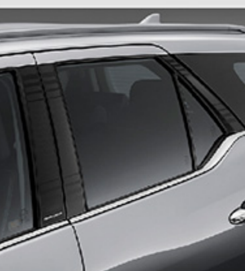
สติ๊กเกอร์ตกแต่งเสาประตู