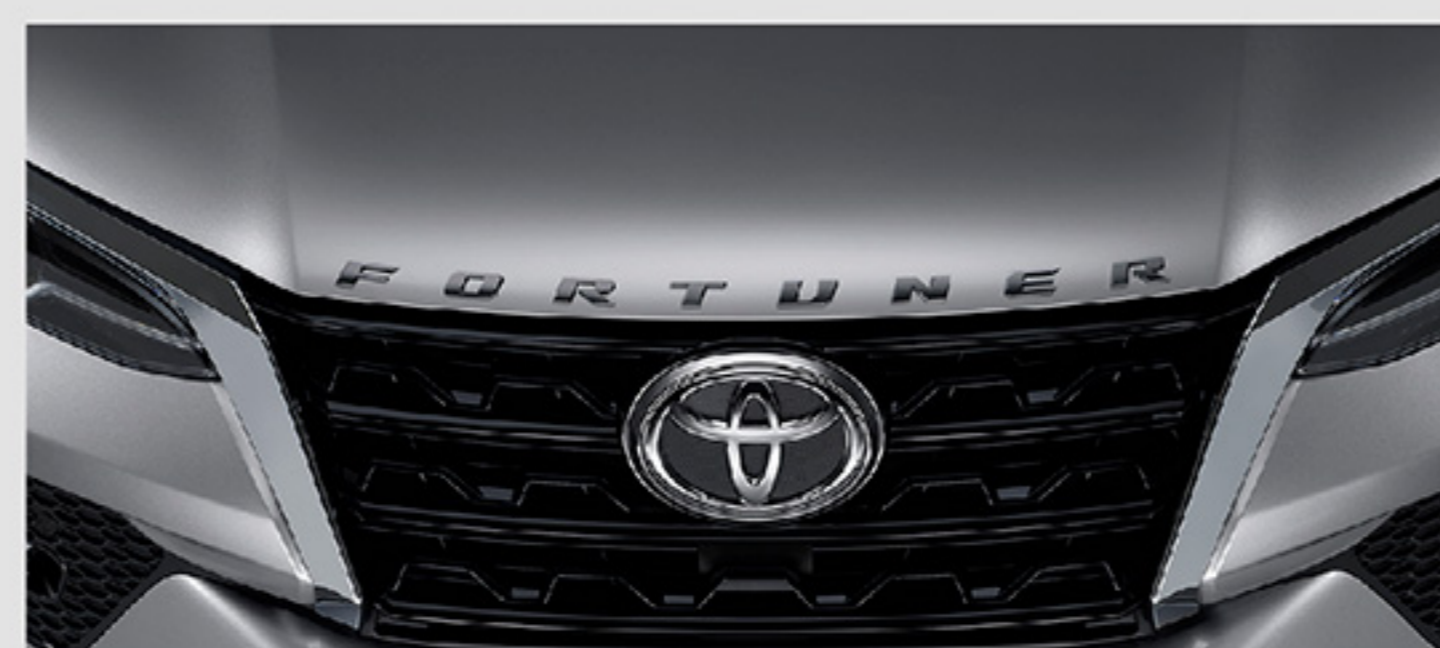
โลโก้ Fortuner (สีต่างๆ / โครเมียม)