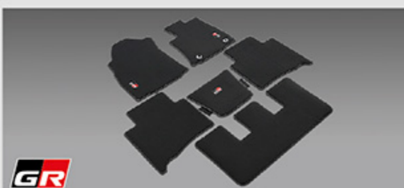
พรมปูพื้นรถยนต์ GR