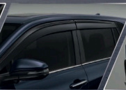
แผงบังแดดข้าง