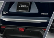
ทิวประตูหลังโครเมียม