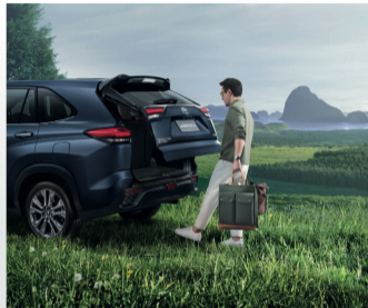
พิกัด - ใช้งานแบบพรีพรีพร้อมระบบ Kick Activated