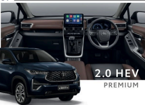
2.0 HEV PREMIUM