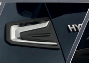
ทิวคอกแต่งซุ้มล้อโครเมียม