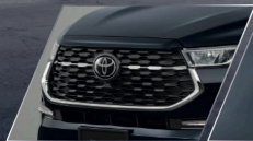
ทิวกระจังหน้า