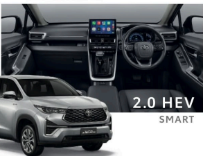
2.0 HEV SMART