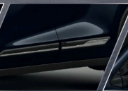
ทิวกันกระแทกประตูโครเมียม