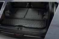
ถาดใส่ของท้ายรถ และถาดใส่ของท้ายรถบริเวณเบาะหลัง

อุปกรณ์ตกแต่งแท้โตโยต้ารับประกันสูงสุด 3 ปี หรือ 100,000 กม.